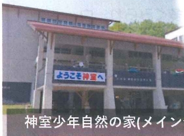
神室少年自然の家(メイン会場)