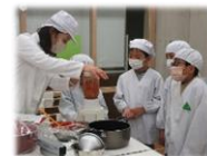
トマトソースづくり