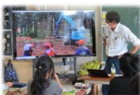
森林管理署出前授業