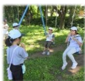
なつがやってきた