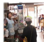
まちたんけん・わたしたちの生活