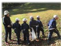
たのしい あき いっぱい