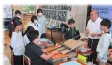
トロッコ列車講話