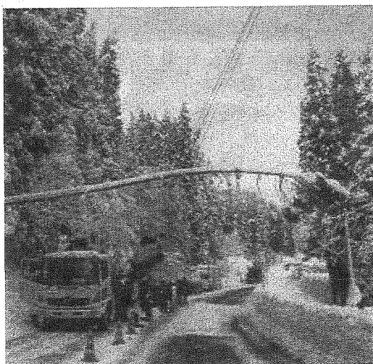
← 雪の重みによる倒木