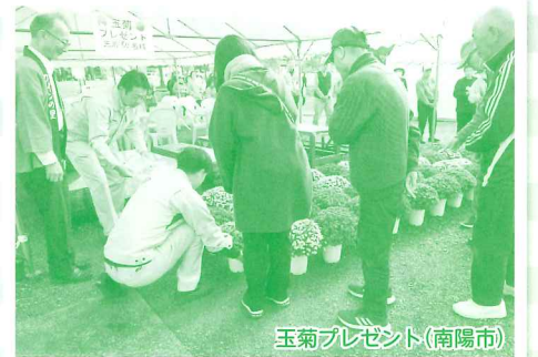
玉菊プレゼント(南陽市)