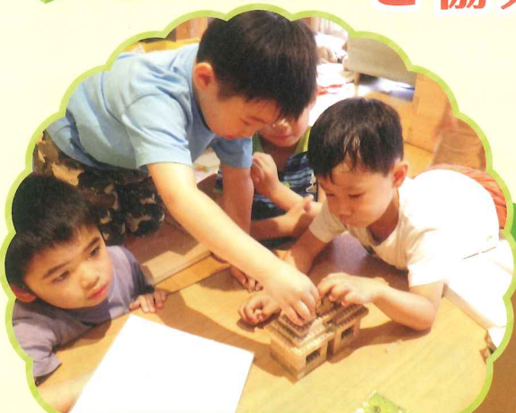
木育活動の支援 (天童市)