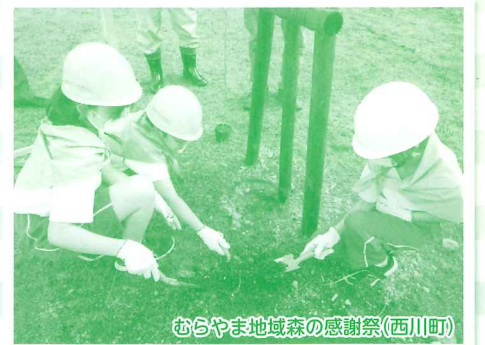
むらやま地域森の感謝祭(西川町)