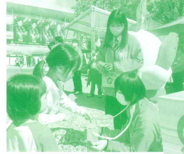
緑の募金活動の様子 (NDソフトスタジアム)