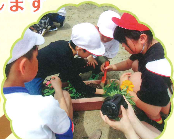
花苗の植栽 (長井市)