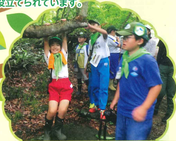
緑の少年団の育成 (西川町)