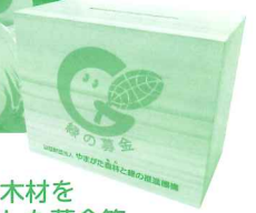
県産木材を使用した募金箱