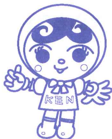
人権イメージキャラクター