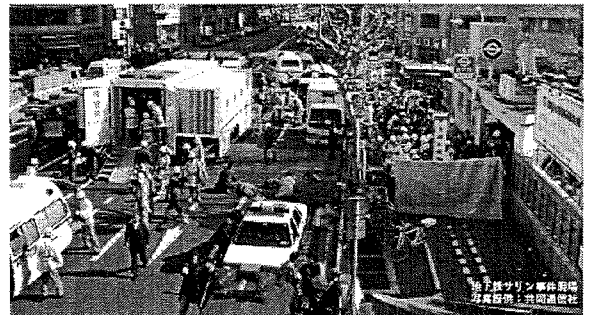
地下鉄サリン事件現場

警察では、 教団の勧誘対象となりやすい若い世代への啓発活動に 取り組んでいます。