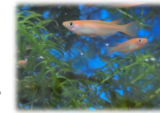
めだかちゃん・・・優雅な泳ぎ(笑)

センター利用についてのお願い ※支援センターは、対象が『小学生未満の幼児』までとなっております。ご理解くださるようお願い致します。