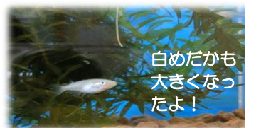
白めだかも大きくなったよ!

センター利用についてのお願い ※支援センターは、対象が『小学生未満の幼児』までとなっております。ご理解くださるようお願い致します。