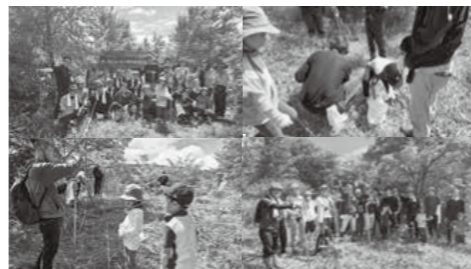
やまがた絆の森の活動(県作成パンフより)

個人情報の管理や生成情報の正確性といった課題を踏まえ、検証や職員研修を行いながら段階的に活用し、住民サービスの向上につなげていきたい。