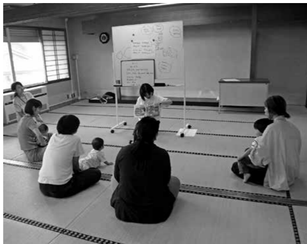
子育て支援センター「読み聞かせ&おしゃべり会」の様子

理、運営を担う体制、人材確保等を考え、慎重に検討する必要がある。 JR及位駅などの周辺環境については、地域の皆様のご意見も伺いながら、及位インター周辺エリアがどうあるべきか、引き続き検討する。