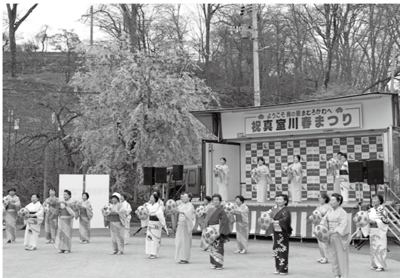
令和7年度の春まつりの様子