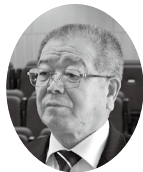
小松 正弘 議員