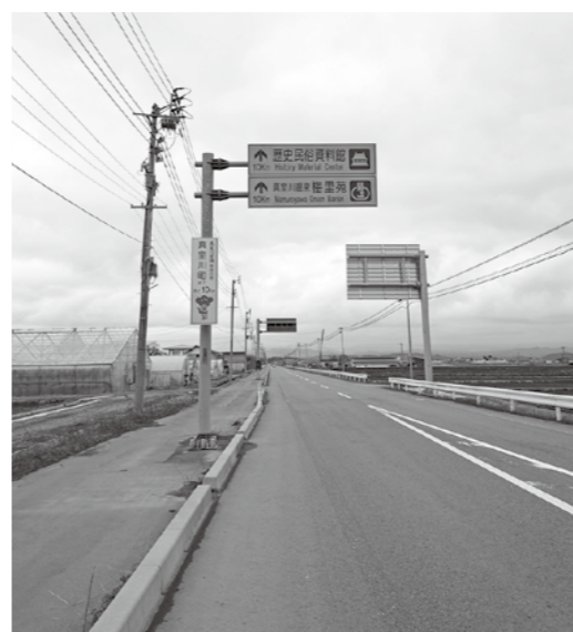
IC付近の町内への案内表示

町に立ち寄ってみたくなる環境づくりを進めるとともに、目的的地となるために、町内の飲食店や特産品販売情報を発信・提供する機会を増やし、町内での消費や滞在につながる仕掛けを強化することが重要。二つ目は、イベントの磨き上げとPRである。四季のイベントを磨き上げ、SNSを活用した情報発信の強化である。本年度と来年度にPRポスター・プロモーション映像を制作、最大限に活用し、町の発信に努める。三つめは、来訪者を単なる観光客ととらえず、繰り返し訪れる関係人口へと発展させることが重要。「ふる