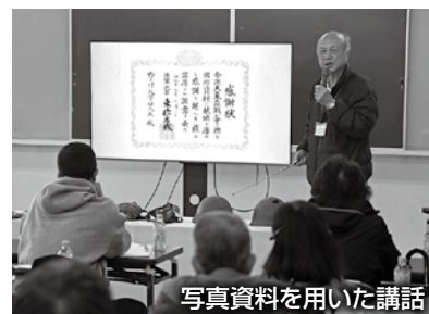
写真資料を用いた講話

当日は、映像と写真資料の視聴、戦時中に使用された鉄兜や日章旗などを見学し、「太平洋戦争と空襲の被害」「真室川飛行場をはじめとする町の戦争の歴史」について学びました。その後、実際に真室川飛行場跡(野々村地区)に移動し、現在も残る格納庫の基礎部分を確認し、真室川飛行場はどのような場所であったのかを学びました。続く慰霊塔・忠魂碑(真室川公園内)の前では、追悼の意を込めて黙祷と献花を行い、「真室川町の戦没者と遺族会の取り組み」について学びました。ツアーをとおして参加者からは「これからの子どもたちに語り継いでいきたい」「改めて戦争はしてはいけない」などの感想が述べられました。