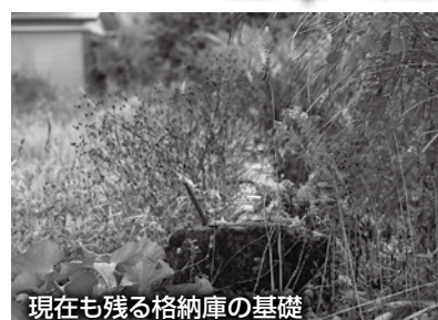
現在も残る格納庫の基礎