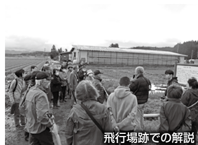
飛行場跡での解説