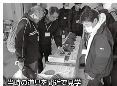
当時の道具を間近で見学