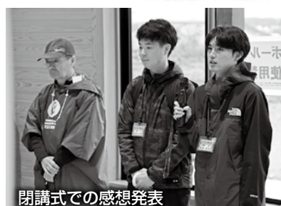
閉講式での感想発表