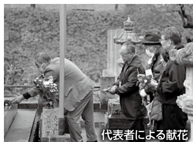
代表者による献花