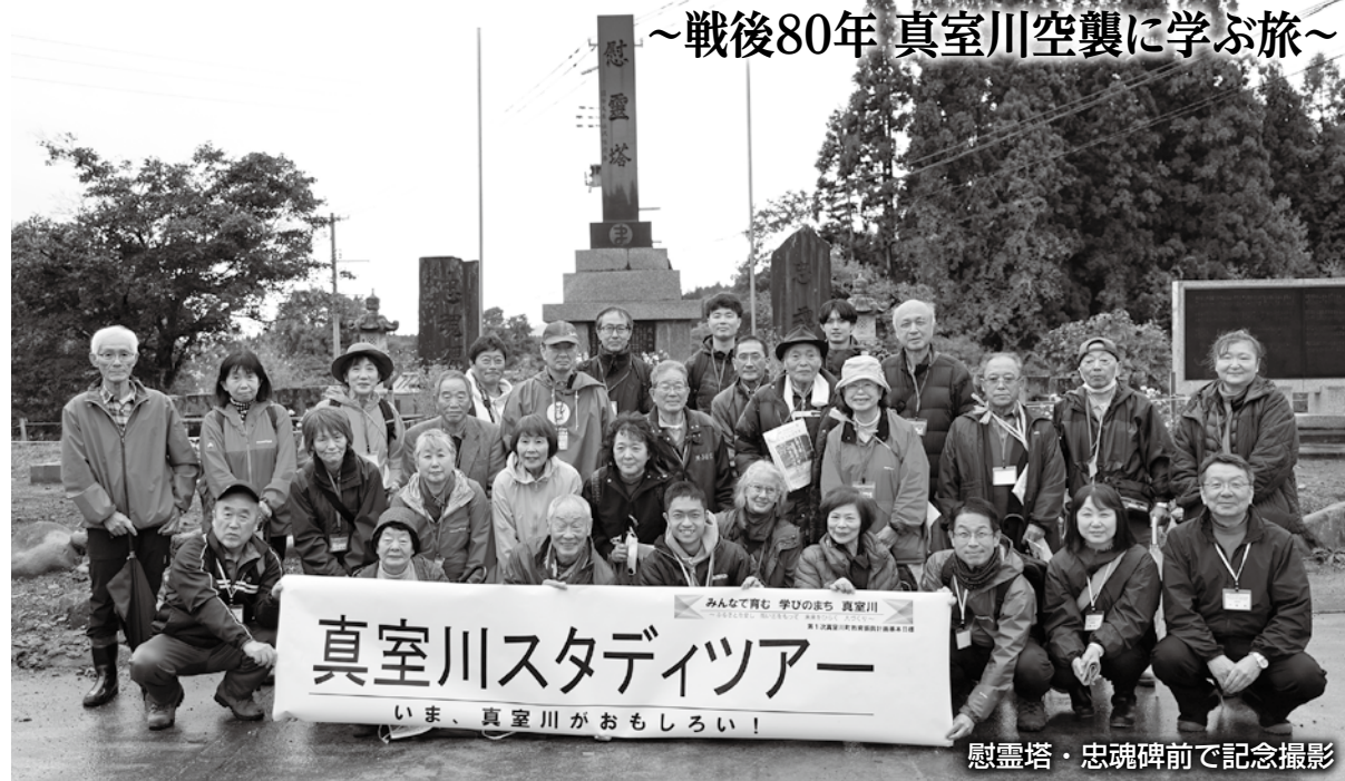
慰霊塔・忠魂碑前で記念撮影

教育委員会では、戦後80年の節目の年に真室川町の戦争の歴史を学び、戦争を風化させずに後世に語り継ぎきっかけのひとつとするために、「忘れてはいけない戦争の歴史を語り継ぐ～戦後80年 真室川空襲に学ぶ旅～」と題して、11月1日(土)に第14弾真室川スタディツアーを開催しました。