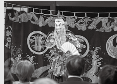
八敷代番楽「武士舞」

10月19日(日)、ふるさと伝承館で第33回番楽フェスティバルを開催しました。地域に伝わる伝統芸能「番楽」を深く堪能してもらおうと、町内3団体(八敷代番楽・釜淵番楽・平枝番楽)と、招待団体の本海獅子舞番楽猿倉講中(秋田県由利本荘市)、柳原番楽(金山町)による迫力ある舞が披露され、会場内は観客の目線で繰り広げられる圧巻の舞と熱気に包まれました。