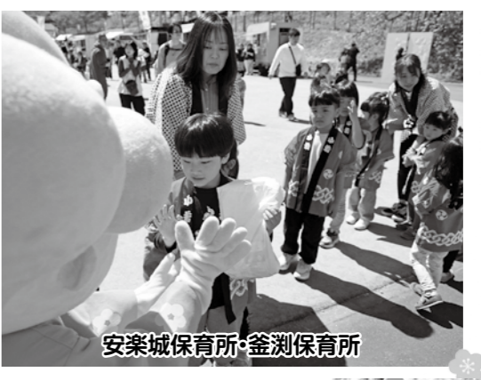
安楽城保育所・釜淵保育所