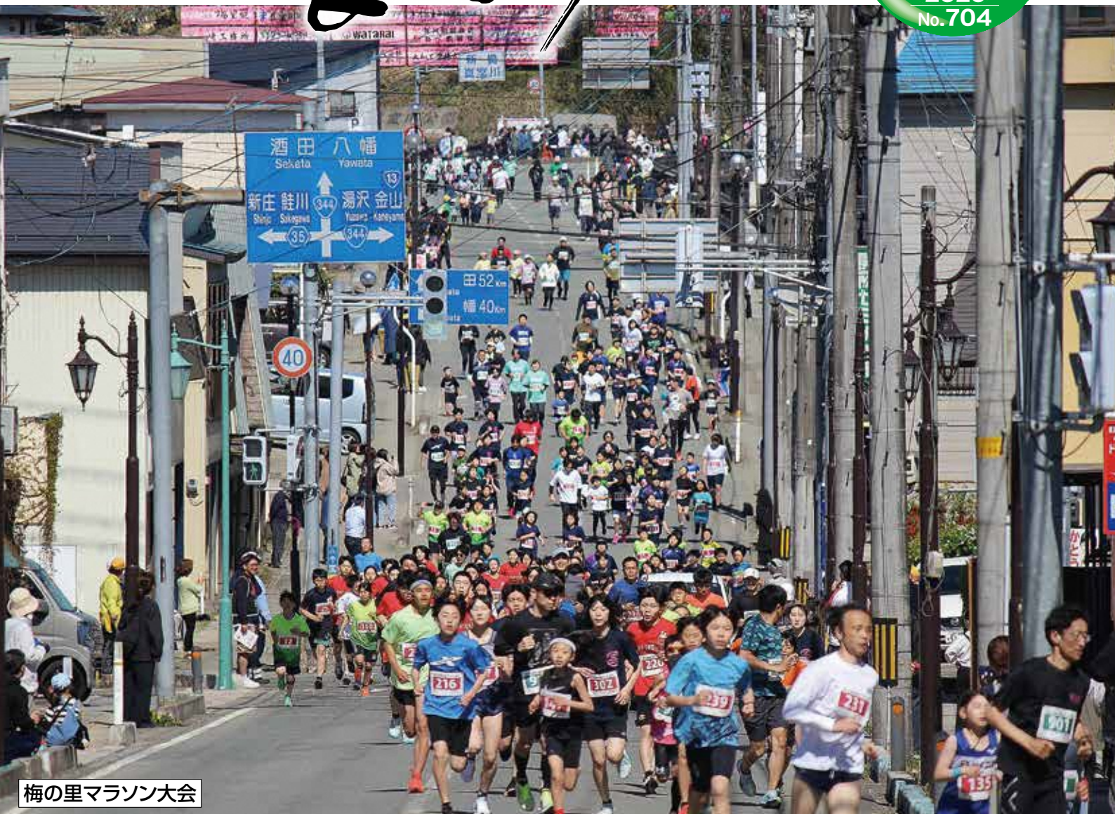
梅の里マラソン大会