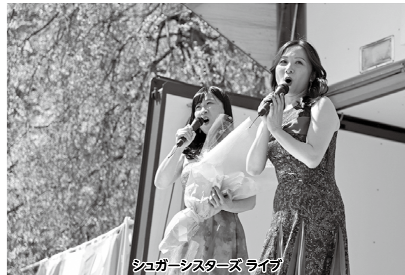
シュガーシスターズライブ