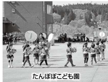
たんぼぼこども園