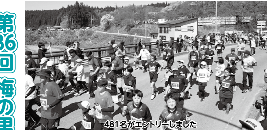
481名がエントリーしました