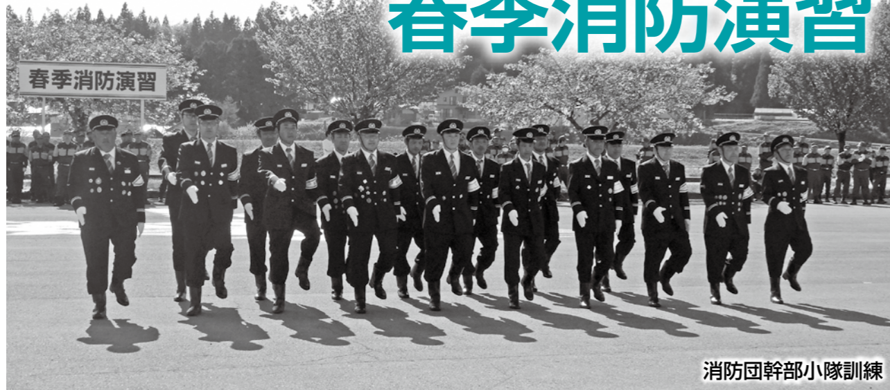
消防団幹部小隊訓練

4月26日(日)、真室川駅前通りと真室川防災センターを会場に、令和8年度春季消防演習が行われました。団長の指揮のもと、消防団員が一同に会し、日頃の訓練の成果から息の合った動作を披露しました。また、たんぼぼこども園の年長園児がかわいらしい踊りとともに火の用心を呼びかけ、演習に華を添えました。