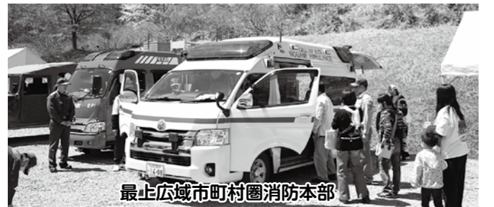
最上広域市町村圏消防本部