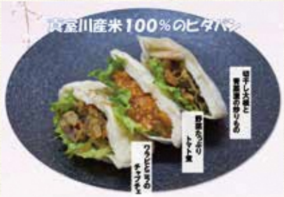
▲ピタつまむろがわ

昨年12月号でお伝えした、(自称)真室川の新ファストフード「ピタつまむろがわ」が、まむろがわ春まつりでデビューしました!! 「ピタつまむろがわ」はドラえもんポケットのよう