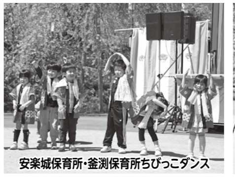
安楽城保育所・釜淵保育所ちびっこダンス