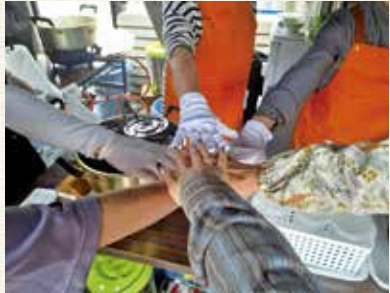
力を合わせて頑張ります！

います。みなさんと一緒に真室川町の特産品を作っていきましょー！多くの皆さんのご参加お待ちしております。 食彩まむろがわの「ピタつまむろがわ」次の出店は、6月27、28日開催のさなぶり仕事まつりです。お越しの際は、ぜひ食彩まむろがわのブースにもお立ち寄りください！