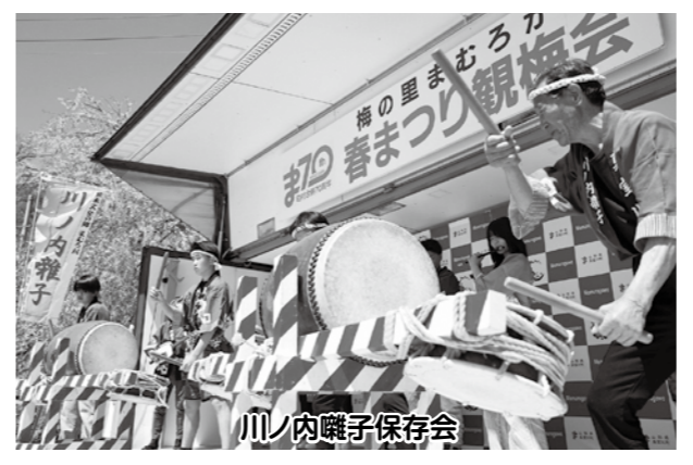
川ノ内囃子保存会