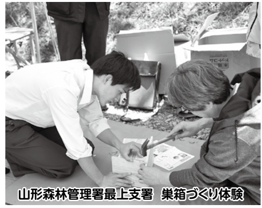
山形森林管理署最上支署 巣箱づくり体験