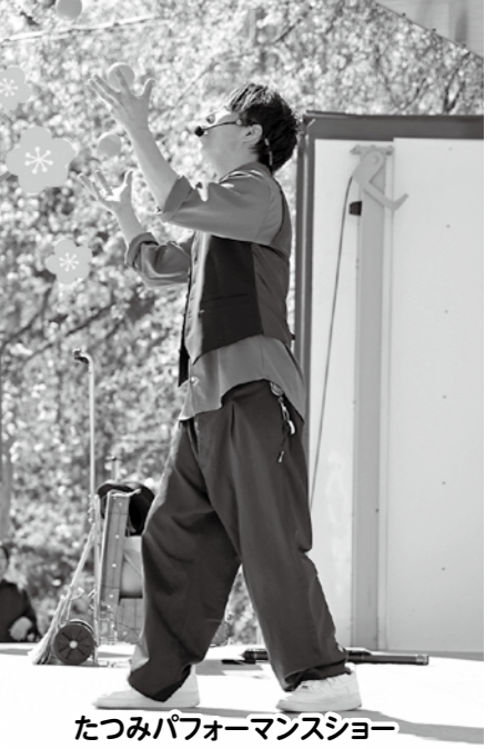
たつみパフォーマンスショー

梅が咲き誇る中、「梅の里まむろがわ春まつり」が開催され、期間中は多くの皆さまにご来場いただきました！