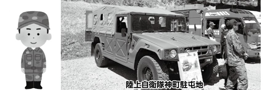
陸上自衛隊神町駐屯地