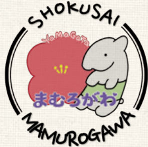
▲食彩まむろがわのロゴ