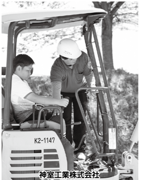
神室工業株式会社