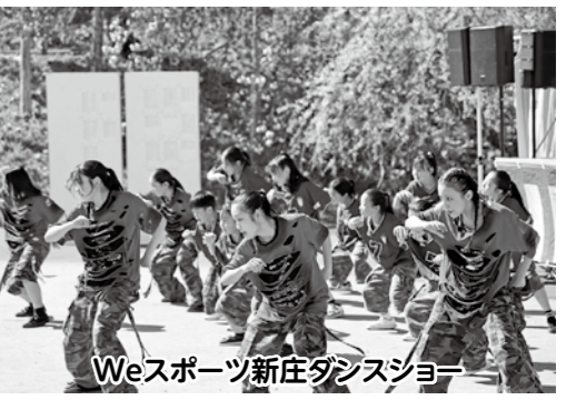
Weスポーツ新庄ダンスショー